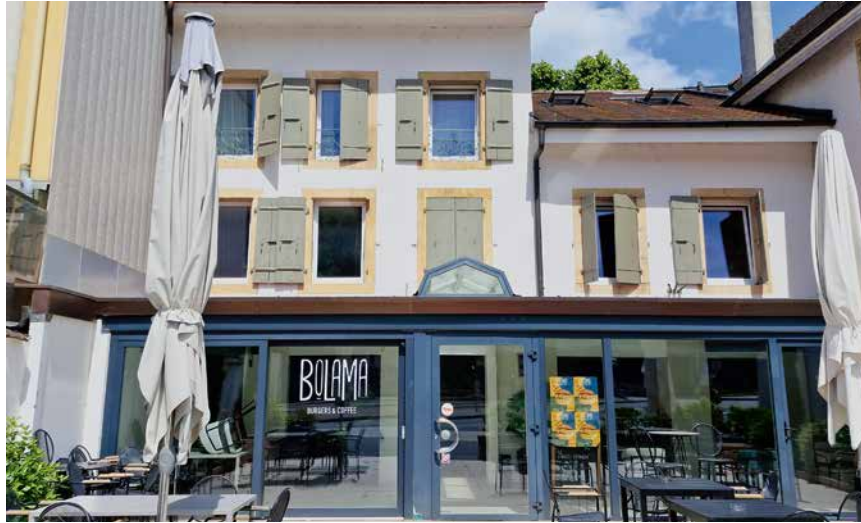
La maison à l'avenue du Collège, où le Conseil communal souhaitait créer un centre de loisirs.