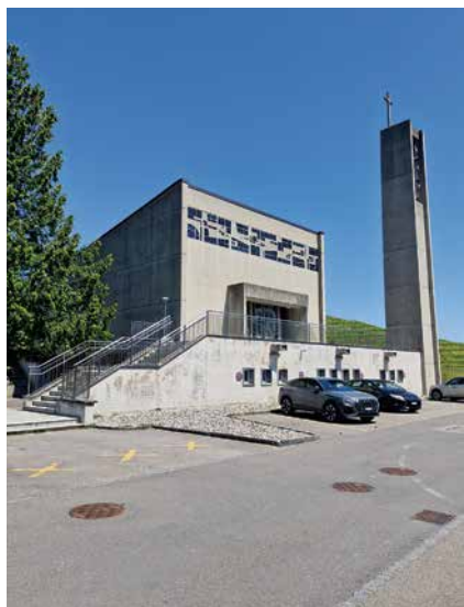
L'église catholique de Boudry est de style architectural brutaliste.

Aussi, lorsque des catholiques boudrysans avisèrent les autorités de la ville de leur intention de bâtir une église à Boudry, ces dernières saluèrent cette initiative. Elle mirent d'ailleurs la salle du tribunal situé dans l'hôtel de ville à disposition des catholiques