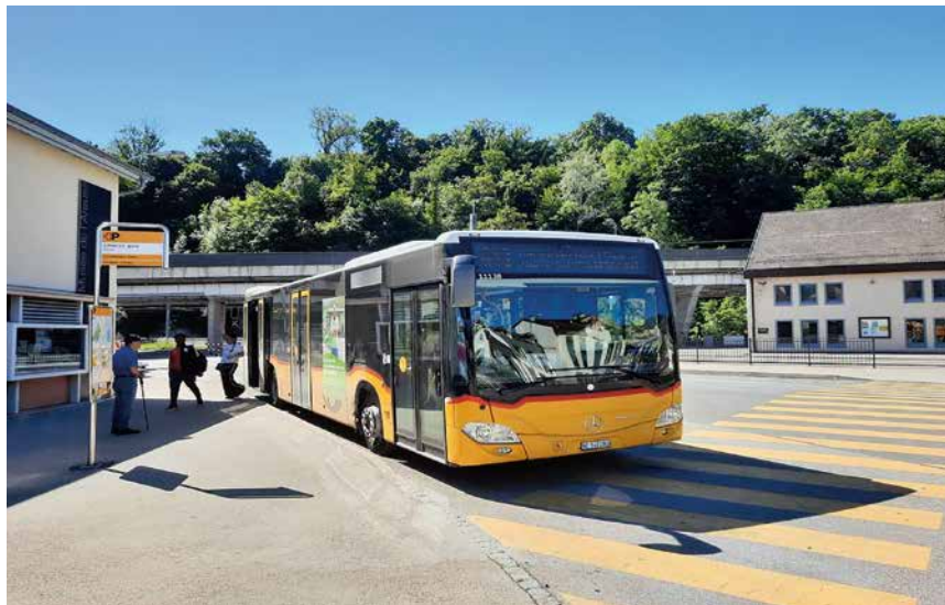
A Boudry, la ligne est aussi importante. Elle permet par exemple aux élèves des quartiers Ouest de prendre le tram afin de se rendre à Cescole.