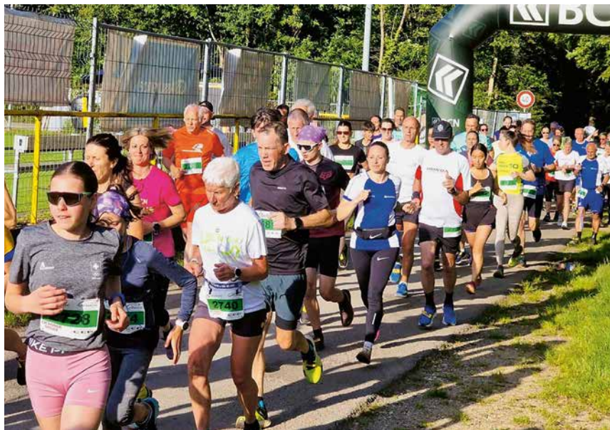
Les Foulées de la solidarité (ici, en 2025) sont inscrites au Championnat de courses à pied Neuchâtel région.

Le mercredi 10 juin, ce sera la 26e édition de cette course conviviale, autrefois appelée «courir pour un monde sans faim». Le ton est donné: on court ou on marche, avec ou sans bâton, pour la bonne cause. Ou plutôt pour deux bonnes causes: un projet protestant de partage des eaux et des terres au Niger, et un projet catholique de