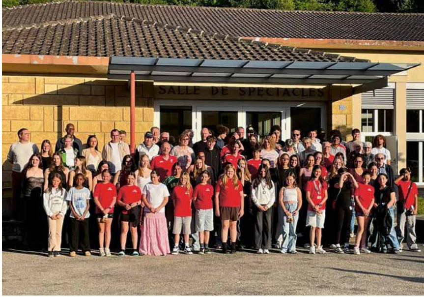
Les lauréats des Mérites sportifs devant la salle de spectacles.