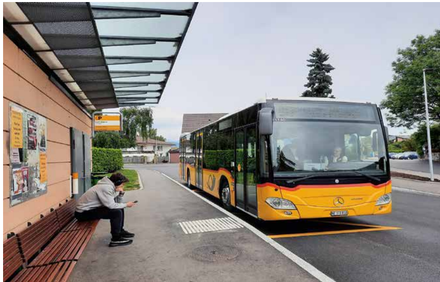
La ligne de bus 613 (ici à Cortaillod) perdra le cofinancement fédéral dès l'horaire 2029, faute de rentabilité.

A Boudry, son importance est aussi jugée primordiale, explique le conseiller communal en charge de la mobilité et des transports, Emile Dubois. «En plus des riverains, nos élèves des quartiers Ouest en ont besoin pour rejoindre le tram et se rendre au Ces-