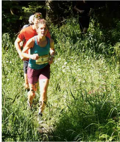
Tous les coureurs font la montée vers la Fruitière de Bevaix.

La nouveauté de cette édition est au niveau du transport. Une navette transportera les participants de la gare de Bevaix jusqu'au départ à la Rouvraie. «Nous voulons encourager l'utilisation des transports publics», souligne Kenny Othenin-Girard, président du comité d'organisation.