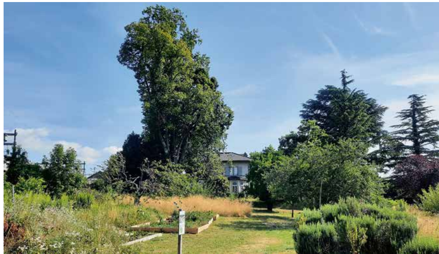
Le parc du Closel, un écrin de verdure au cœur de Bevaix, est enfin accessible.

Les obstacles se multiplient ensuite. Fin 2013, environ 230 arbres sont abattus pour des raisons sanitaires, suscitant une pétition de plus de 580 signatures pour leur remplacement. Le site reste ensuite