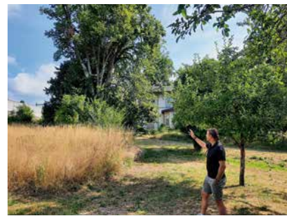
Roger Hofstetter présentant la biodiversité des lieux.

Le site accueille un jardin potager géré par le parascolaire, un sentier didac-