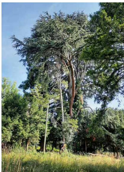
Un majestueux cèdre de l'Atlas, prisé des pics.