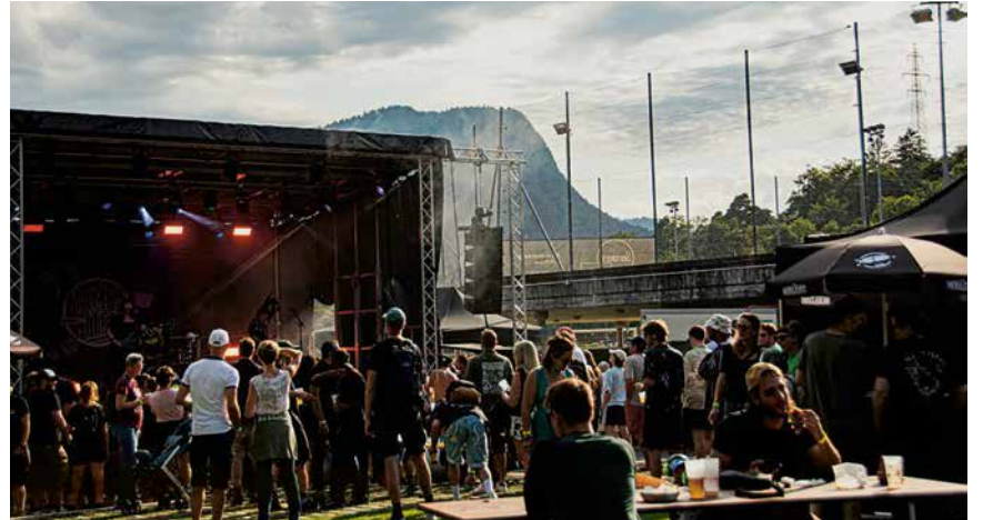
Le ParaBôle festival, c'est d'abord un état d'esprit.

Punk dans l'âme, le ParaBôle mise sur une programmation alternative qui verra défiler une trentaine de groupes sur les trois scènes. « On reste dans le même esprit: du punk, du rap, de l'électro, de la pop », égrène Killian Frangeul. « On aime varier les atmosphères, ménager des surprises, créer des montagnes russes musicales. » La programmation complète figure sur le site du festival.