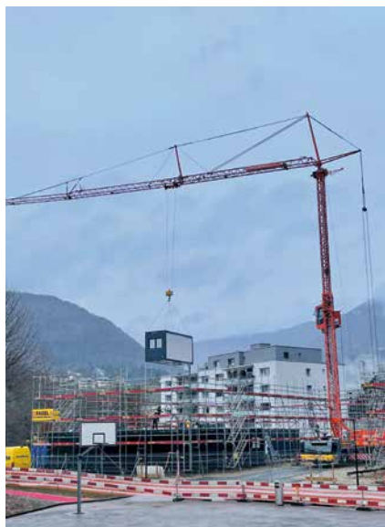
Une grue imposante décharge et place les conteneurs.

«Ils sont bien isolés et équipés d'une pompe à chaleur réversible qui chauffe en hiver et rafraîchit en été.» Le coût de 3,5 millions de francs est intégré dans l'enveloppe de 22 millions votée par le