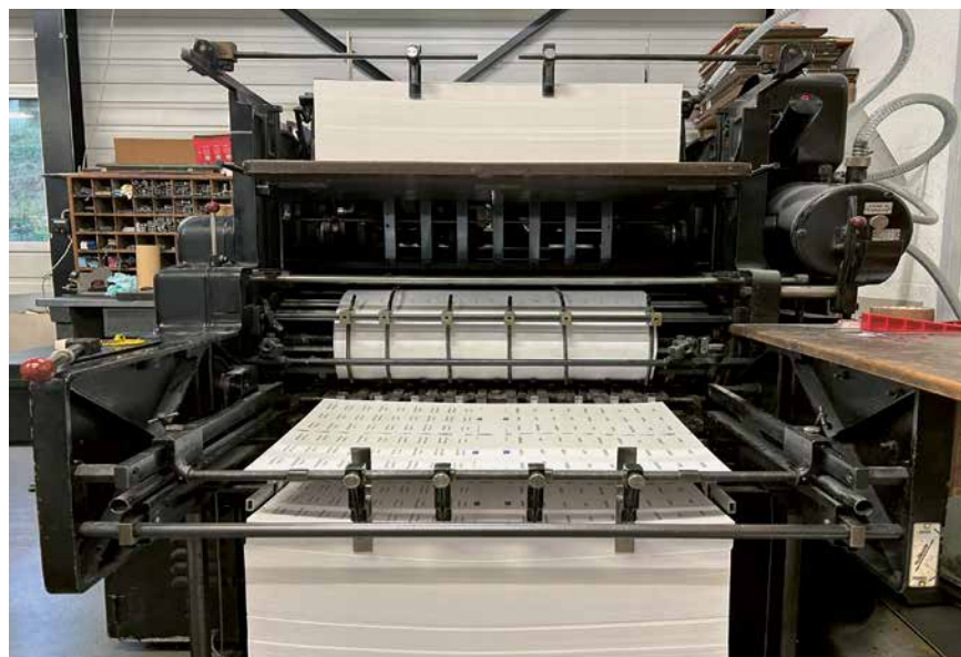
Le journal a été imprimé sur cette vénérable Heidelberg Cylindre Typo de 1956 à 1973.