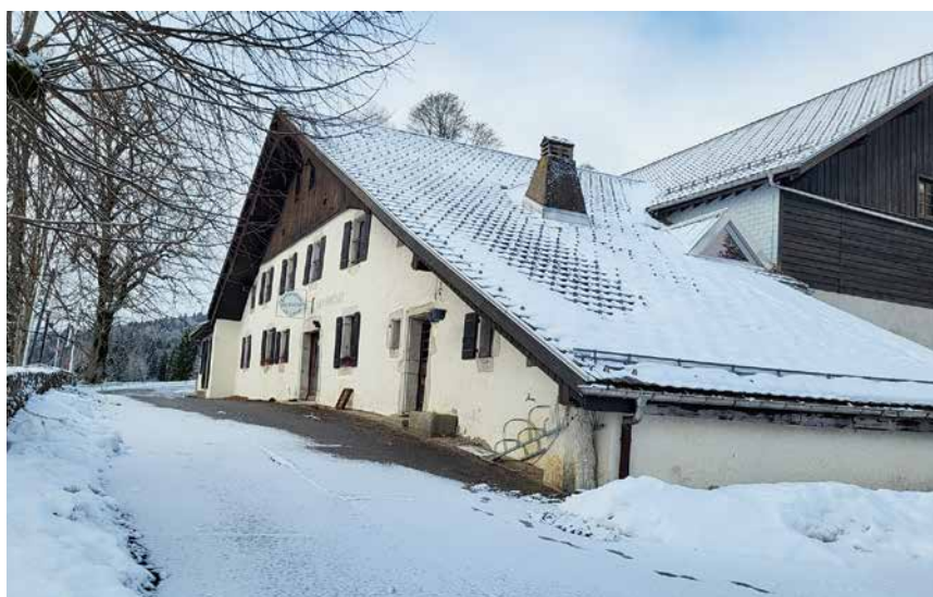
Propriété de l'armée, le restaurant des Rochats devrait rouvrir, dans les règles de l'art, mais il faudra s'armer de patience.

Ce dernier est aussi devenu propriété de la Confédération, via l'armée. Celle-ci a notamment participé financièrement à l'approvisionnement en eau des Rochats. La société qui exploitait le restaurant ces dernières années a résilié son bail avec effet au 31 mai 2025. Bonne nouvelle: Armasuisse a l'intention de rouvrir