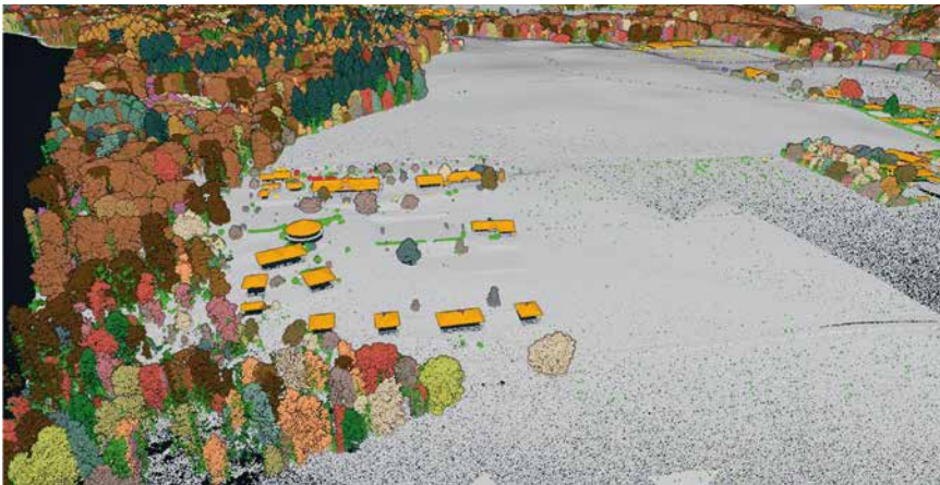
LIDAR différencie les espèces par des couleurs différentes.