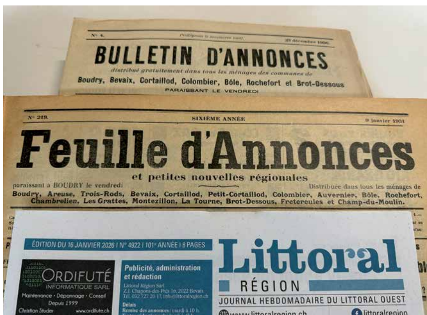
Les trois visages du journal au fil de son histoire.