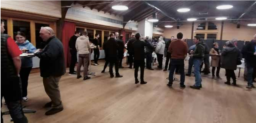
La majorité des 60 participants a profité de l’apéritif.