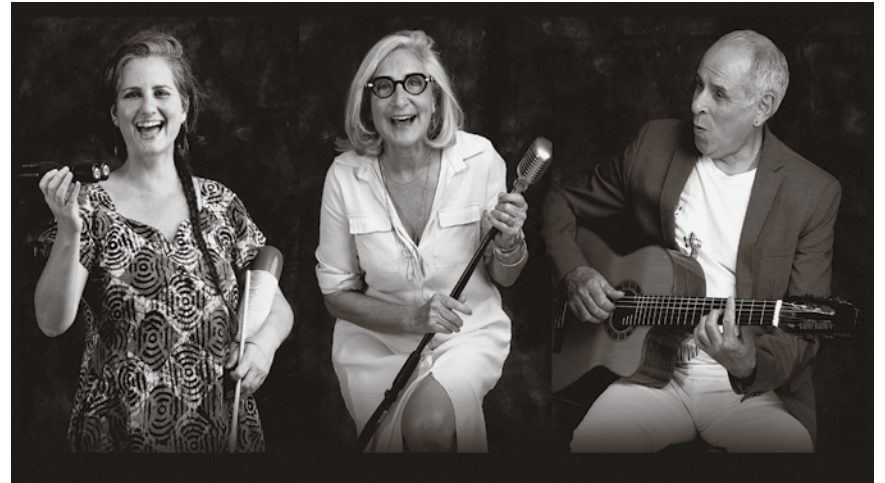
Trois artistes pour une balade musicale sans frontières.