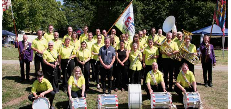
La fanfare défendra ses couleurs à la Fête fédérale de musique à Bienne.

La Fanfare Béroche-Bevaix participera à la Fête fédérale de musique en mai prochain à Bienne. En guise de répétition, elle se produira le 21 mars à la salle de spectacles de Saint-Aubin en espérant récolter des fonds pour financer l'expédition.