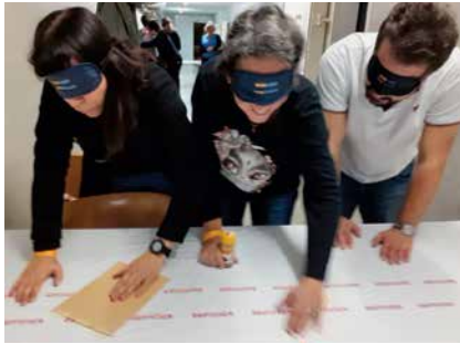
L'escape game proposé à Boudry se jouera dans le noir total, sans les yeux bandés.