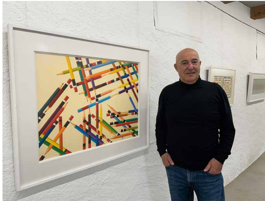
Domenico Sorrenti et «Congestion du trafic».

Inclassable, Domenico Sorrenti a développé son propre langage, à l'écart des modes et des courants. «J'aime l'aspect monumental du crayon, qui me permet de rendre 'monumentales' mes idées. Il est devenu une sorte de symbole universel, un moyen d'expression», souligne-t-il. «Les titres sont importants car ils expliquent le tableau, qui illustre toujours autre chose qu'une simple série de crayons: une émotion, une idée, un paysage ou même un son.» Joueur, l'artiste apporte un soin extrême à ses compositions qui ne doivent rien au hasard. Si les crayons