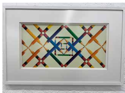
«Le carré à l'infini».