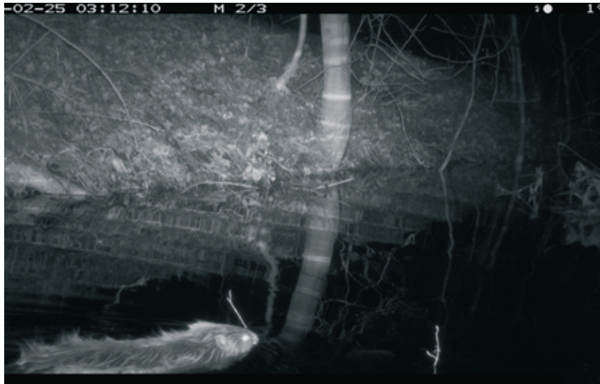
Le castor s'est fait nuitamment tirer le portrait à son insu.

Rien ne bougera toutefois jusqu'au printemps, afin d'occasionner le