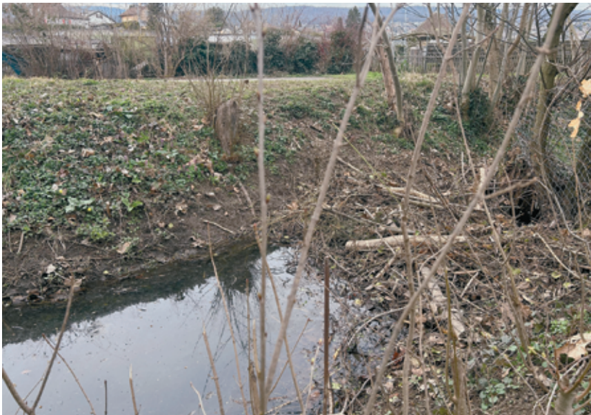
Les travaux de bûcheronnage du castor touchent à leur fin. L'animal devra élire domicile ailleurs.

Le Verny est un ruisseau capricieux qui sort volontiers de son lit pour inonder la route cantonale le long de la voie du tram, vis-à-vis du Bas-des-Allées. L'installation inopinée sur son cours d'un castor animé de vigoureux instincts de bûcheronnage n'a rien fait pour arranger la situation. Un casse-tête pour les autorités communales qui n'ont aucun pouvoir d'intervention: la gestion de la route