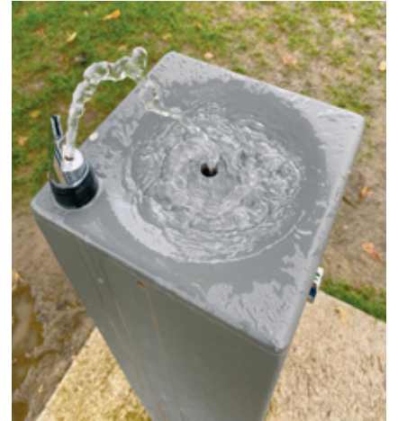
L'or bleu, une richesse qui ne tombe pas que du ciel.

Ces deux passionnés de l'histoire de la région ont choisi d'aborder la problématique sous différents éclairages: techniques, éthiques et environnementaux. «Car si l'approvisionnement en eau potable est une prestation vitale, garantie presque sans conditions, c'est aussi