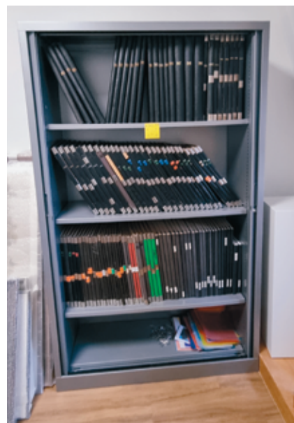
Les exemplaires consultables à la commune.