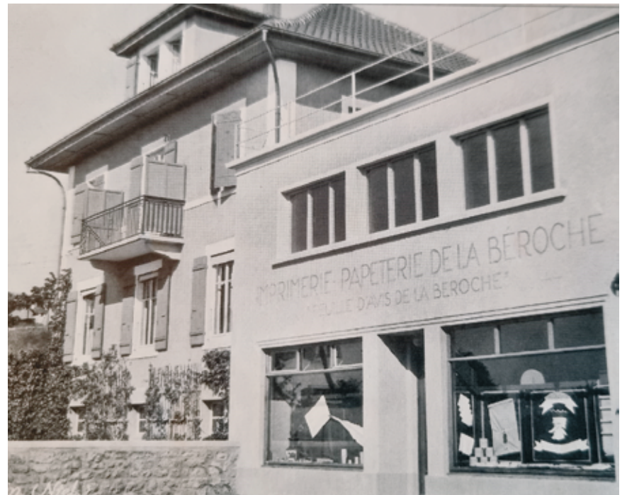
L'imprimerie rue de Fin-de-Praz à Saint-Aubin.