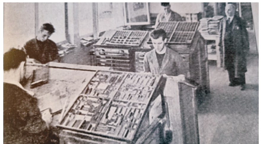
La composition manuelle.