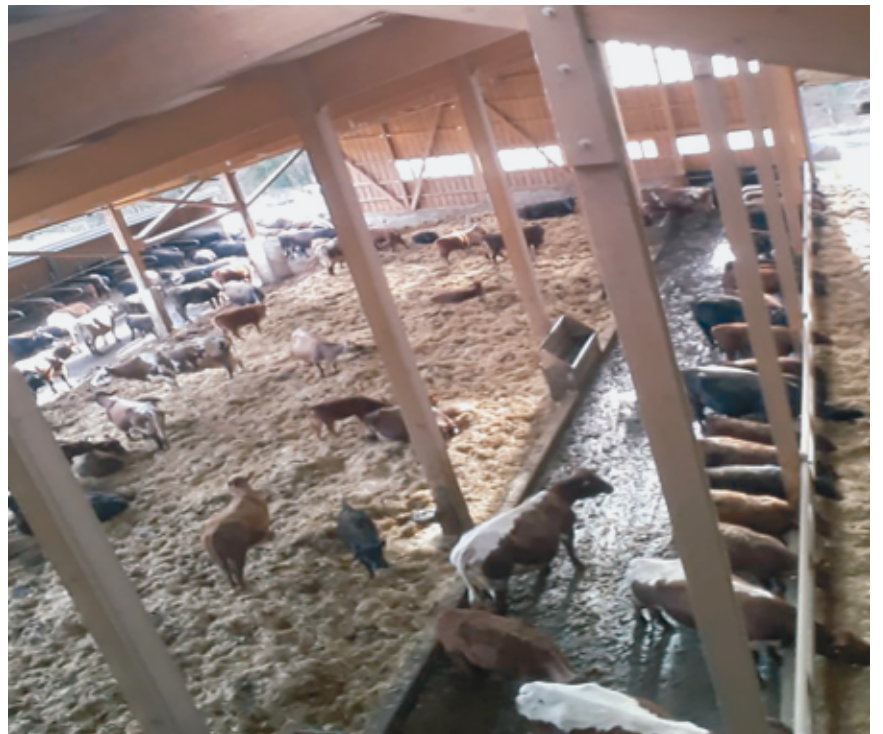
L'étable en stabulation libre de la nouvelle ferme à Châtillon.