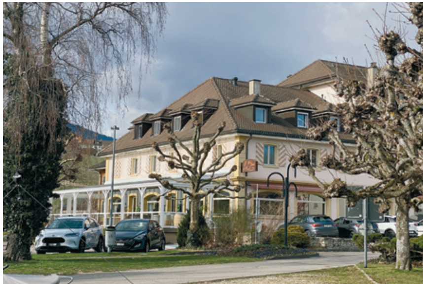
Le Vaisseau devrait reprendre vie en juin, sous un nouveau nom.