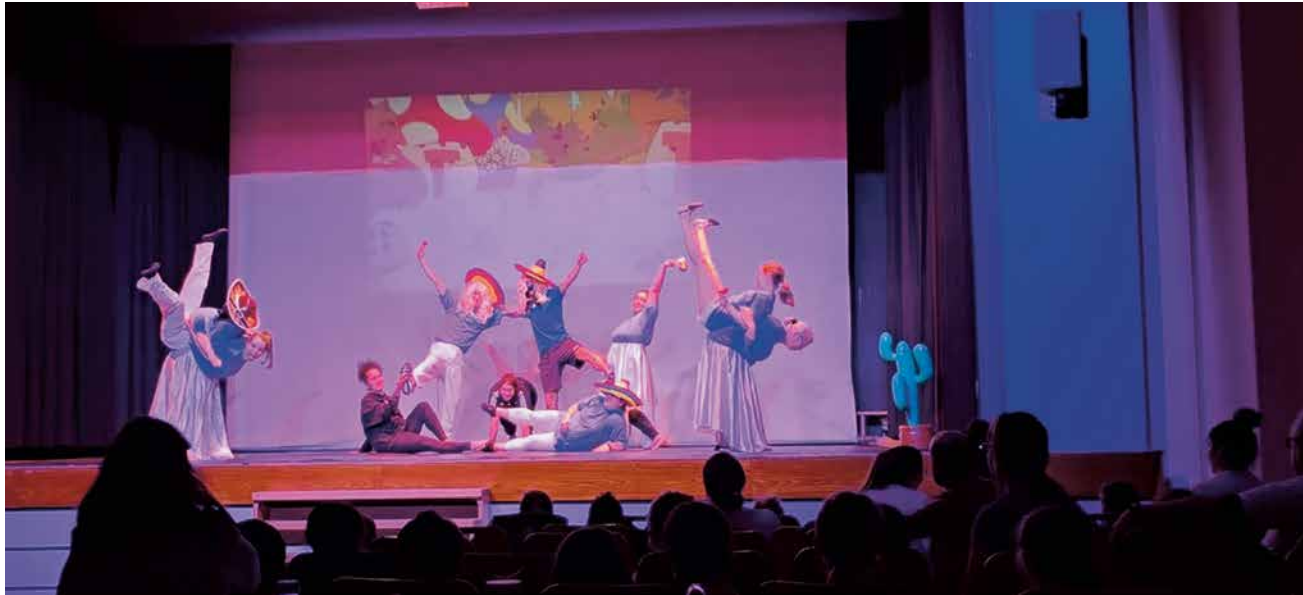
En 2025, le spectacle avait fait salle comble.