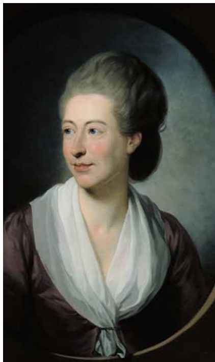
A gauche, Belle de Zuylen, en 1759, et à droite, Isabelle de Charrière en 1777. Deux portraits d'une même femme, noble en Hollande, roturière au Pontet.

«C'était une femme indépendante, d'une intelligence hors-normes: à 13 ans, elle lisait déjà 'De l'esprit des lois', de Montesquieu. Elle a repoussé tous les prétendants titrés que sa famille lui proposait, pour épouser un homme qui la laisserait libre