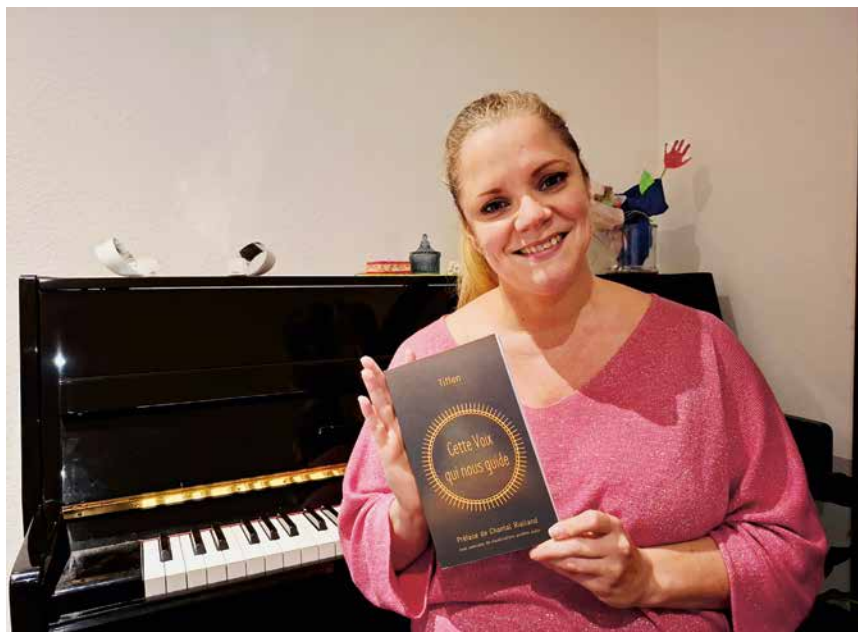
Tiffen a développé une méthode intuitive et généreuse.

«On m'a beaucoup aidé à cette époque, je n'avais pas la capacité de travailler seule, mais j'ai compris que le chant allait devenir ma vie. Je me suis rendu compte aussi que les méthodes acadé-