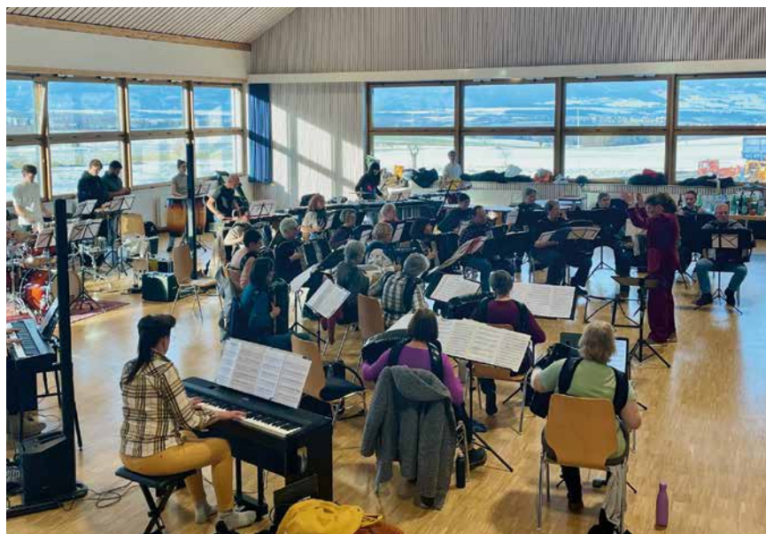
L'ensemble Accordissimo OpenDoor répétait exceptionnellement à Suchy (VD), dimanche dernier avec tous les musiciens.

Elle précise également que l'ensemble sera composé de 25 accordéonistes, sept percussionnistes, deux pianistes et un guitariste à l'occasion des événements du samedi 24. La musicienne nous révèle la raison de la participation de Concertino Band: «Nous nous sommes revus au Festival mondial de l'accordéon d'Innsbruck en mai dernier et avons convenu de monter quelque chose ensemble.» Carolyn Woods, direc-