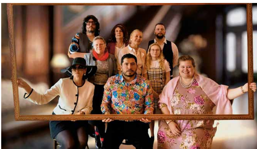
Plusieurs rôles masculins ont été adaptés pour permettre à des actrices de jouer «La Rose noire».