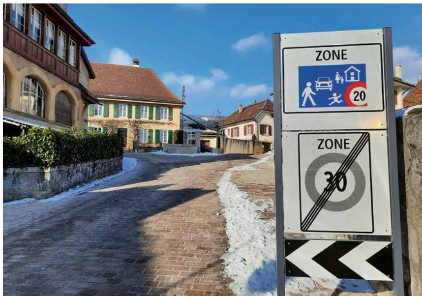
A peine posés, certains pavés devront déjà être enlevés afin de permettre la finalisation du raccordement à la fibre optique!

«Nous les avons convoqués afin qu'ils viennent nous expliquer la situation», a révélé en fin séance