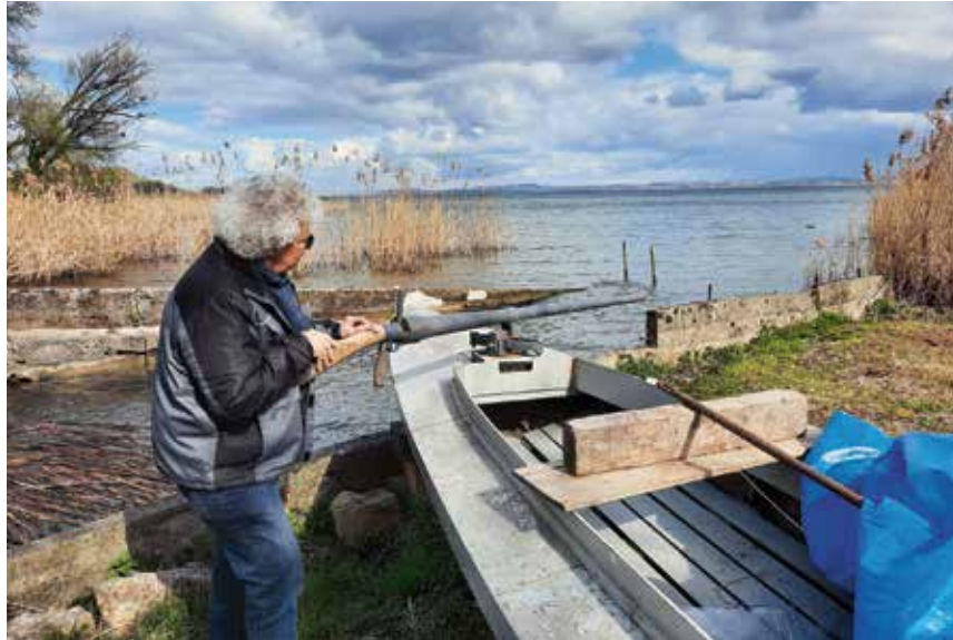
La canardière avec son grand fusil pour la chasse au canard, sera rénovée.

Si le musée vit de dons, le nouveau président souhaite «trouver d'autres ressources financières pour en assurer le fonctionnement à long terme. Peut-être avec la commune ou le canton». Mais la fin de la rénovation des baraques de pêcheurs fait que «nous en avons ter-