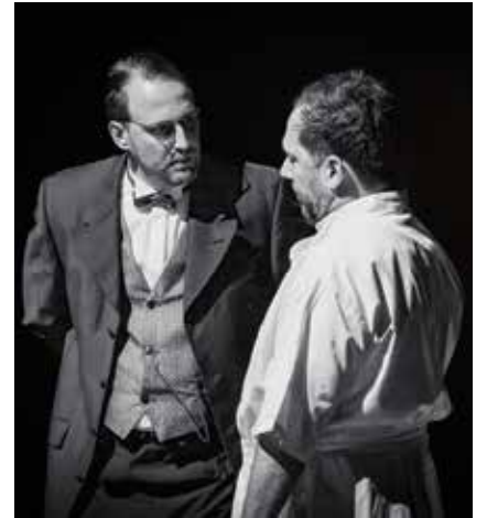
Le collectif Les Mécaniques invisibles revisite l'histoire de l'homme éléphant.

Véritable hymne à l'amour et à l'amitié entre tous les êtres, éloge à la beauté de