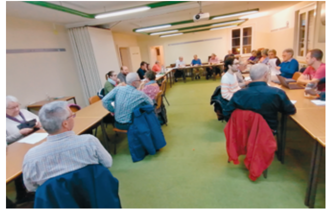
Seize des 26 associations membres de l'ASLB étaient représentées le 8 novembre.

L'Association des sociétés locales de Bevaix (ASLB) et l'Association des sociétés bérochales (ASB) ont tenu chacune une assemblée générale extraordinaire début novembre. Si le projet de contrat de fusion a été accepté à l'unanimité par les deux entités, quelques divergences mineures demeurent au niveau des statuts.