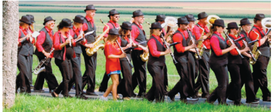
L'Harmonie de Colombier lors du 100e anniversaire de l'Association cantonale des musiques neuchâteloises, le 20 août dernier, sous le soleil de Cernier.

«Toutes ces activités permettent de maintenir la motivation et le niveau de la quarantaine de musiciens que compte