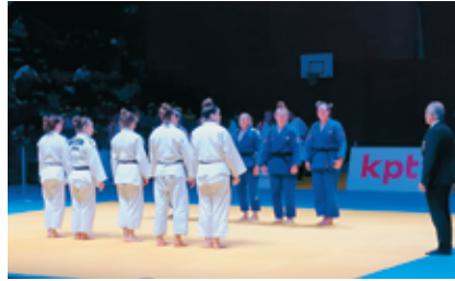
Les filles de Cortaillod, en blanc, face à celles d'Uster.

Présent à la Riveraine, Littoral Région a constaté que tous les détails étaient réglés précisément, depuis l'horaire des combats jusqu'aux emplacements réservés à la pesée des concurrents en pas-