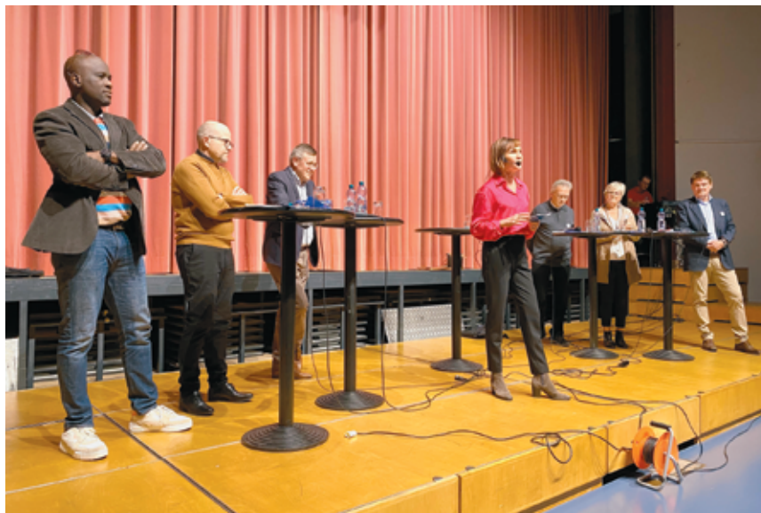
De gauche à droite, les «sceptiques», l'animatrice et les partisans, sur la scène de Cort'Agora.