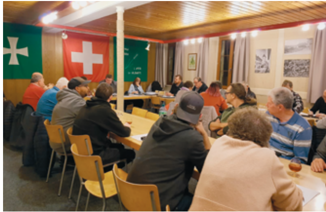
Seize associations représentées pour l'ASB le 9 novembre mais sur 30 membres.