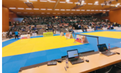
La salle de la Riveraine se remplit; lors de la finale elle était pleine avec 1200 spectateurs.