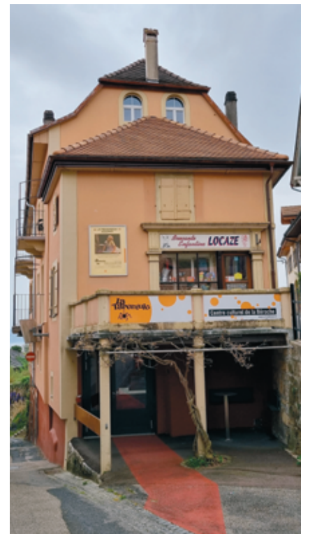
L'immeuble du Centre culturel de La Grande Béroche, rue du Temple 35 à Saint-Aubin.

L'interpellation a été bien accueillie et sera transmise à l'équipe d'animation qui devrait être renforcée si ce nouveau cap était pris. De l'intergénérationnel dans la culture, voilà le plaidoyer de Jona-