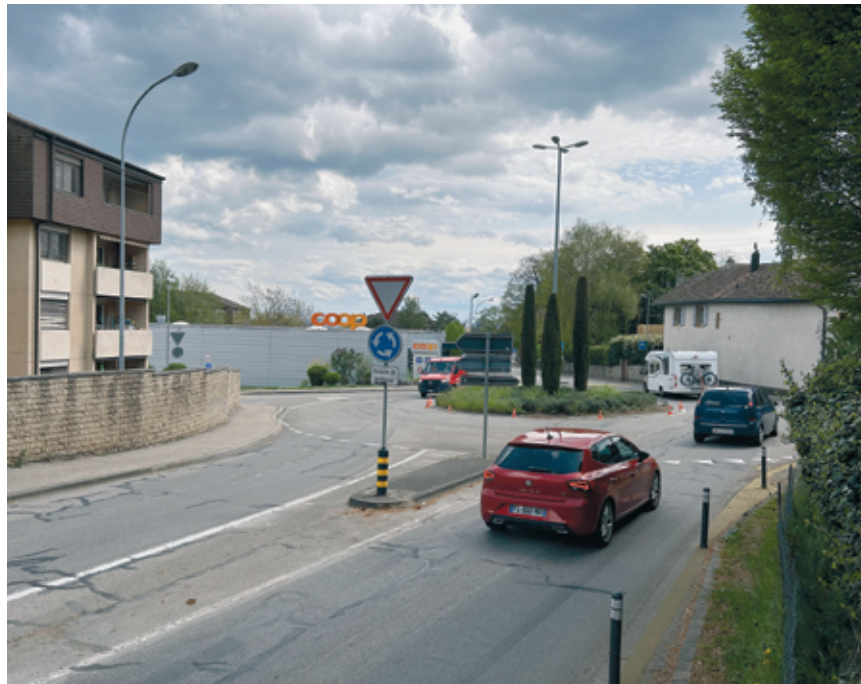
La semaine, environ 8000 véhicules par jour empruntent la route de Sombacour.

La décision du canton de remplacer l'enrobage de la route, trop bruyant et en mauvais état, par un revêtement antiphonique a contraint la commune à planifier la réfection de ses infrastructures souterraines. La route sera réaménagée de manière à réduire la vitesse de circulation, notamment par la création de deux