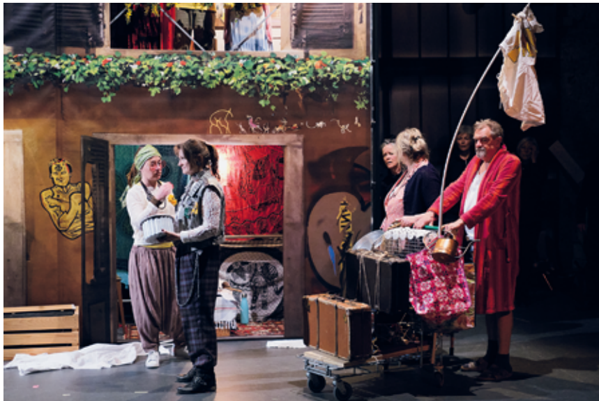
Une faune un rien marginale lutte pour la survie de la zone à défendre.

«Cette histoire de zone à défendre me trottait dans la tête et je l'ai écrite à travers les contraintes fixées par les chansons», explique Frederica Gianfelice, qui a également conçu les décors. La pièce est construite autour d'un vieil immeuble voué à la démolition, squatté