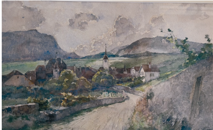
Paul Bouvier peignait toujours sur place, ici la route des Clos à Auvernier, en 1885.

L'exposition présente plus de 80 aquarelles, issues de trois collections privées, qui représentent en majorité des paysages