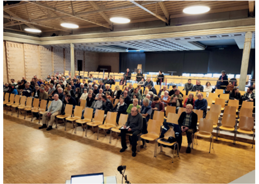
Belle affluence à la salle de spectacles de Saint-Aubin.