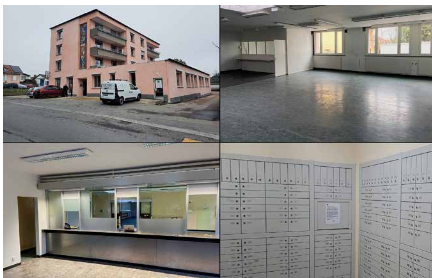
Les locaux pour le parascolaire seront disponibles dès la rentrée d'août. Certains éléments comme le guichet ou les cases postales seront conservés.