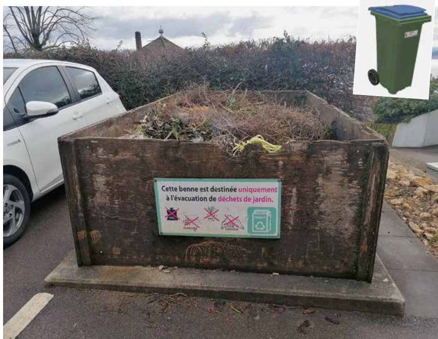
Les conteneurs ne remplaceront pas immédiatement les bennes à déchets verts.

Le socialiste Thierry Rothen a maintenu l'amendement déposé en argumentant que l'exécutif avait agi avec précipitation en diffusant son mémoire déchets avant les débats en plénum. Il s'est également inquiété de l'absence de définition du lieu de collecte (quelle porte?) et du sort des petits seaux utilisés par les personnes seules.