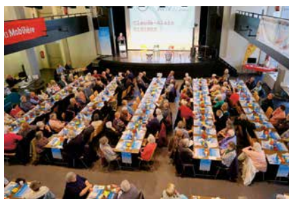
L'an dernier, le forum de l'Avivo s'était tenu à La Chaux-de-Fonds.

La Grande Béroche compte plus de 1000 retraités. Elle a envoyé 500 invitations à des seniors situés dans la tranche d'âge 75-85 ans, en les incitant à s'inscrire au plus vite, mais au plus tard le 28 février. Les 100 premiers inscrits seront prioritaires. Si elle a encouragé ceux-ci à s'annoncer rapidement, c'est que l'Avivo a, bien sûr, invité ses membres qui eux sont au nombre de 1900! Pour les invités de La Grande Béroche, les cafés-croissants, l'apéritif et le repas