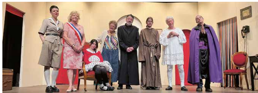
La troupe de La Beline lors d'une récente répétition.

Un trésor dans le jardin du curé La comédie «Ainsi soit-il!», de Jean-