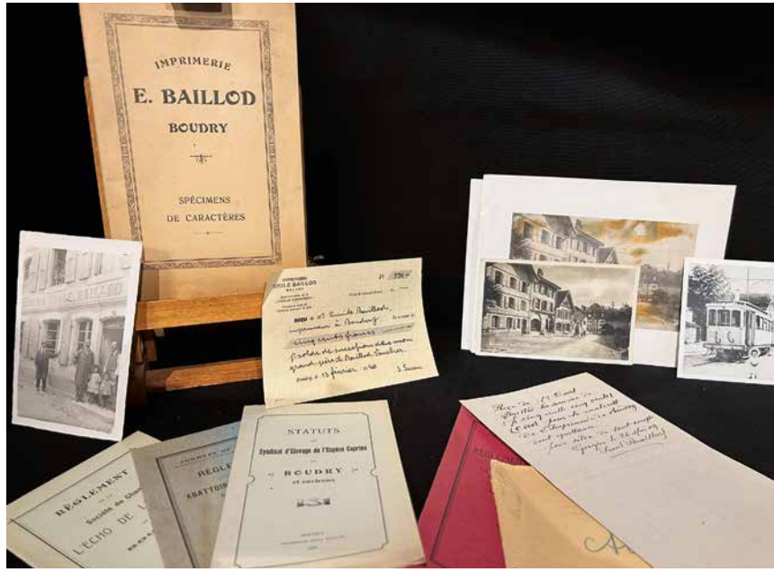
L'histoire de l'Imprimerie Baillod est indissociable de celle de Boudry.

Sur la base de quelques dates clés dans l'évolution de l'entreprise, les deux concepteurs ont élargi le spectre pour évoquer l'histoire de l'imprimerie depuis la révolution initiée par l'invention de Gutenberg vers 1450. «Dans l'histoire de l'imprimerie, la Suisse et le canton de Neuchâtel sont