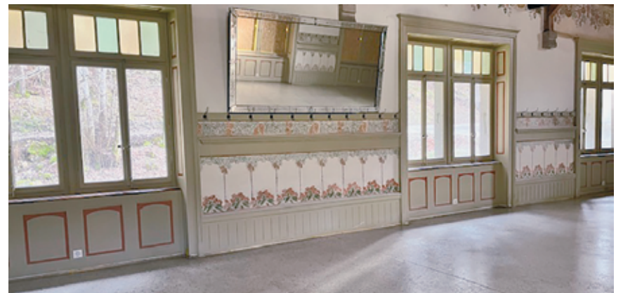
Le sol de la salle des fêtes avant travaux.

Le bâtiment conçu par l'architecte Henri Chable devait augmenter la capacité d'accueil du restaurant; ce dernier jouissait en effet du développement tou-