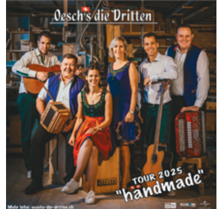
Un yodel tout feu tout flamme.

bernois partira en tournée à travers toute la Suisse avec son nouveau programme nommé «Händmade». La devise «Händmade» est synonyme de musiques composées et interprétées par Oesch's die Dritten et au style reconnaissable entre tous. Une expérience inoubliable pleine d'énergie, de joie et de bonheur.