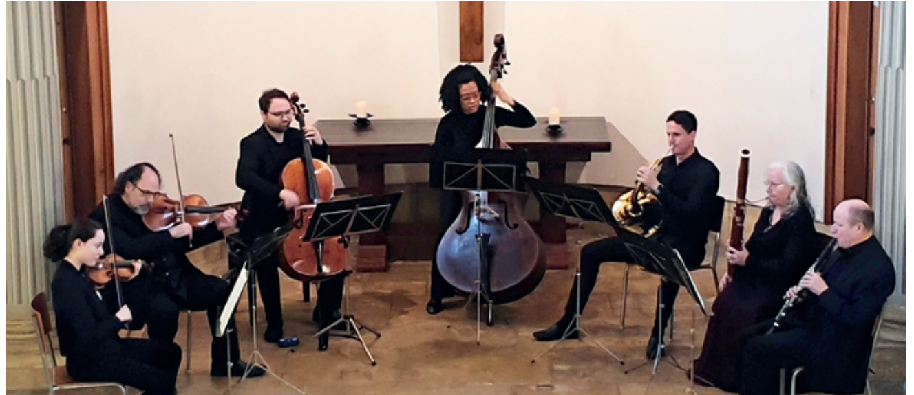
Les Chambristes sont désormais implantés de façon régulière à Bevaix, Bienne, Courtelary, Neuchâtel et Tramelan.

Mais si l'œuvre de Beethoven est un divertimento léger, celle de Schubert