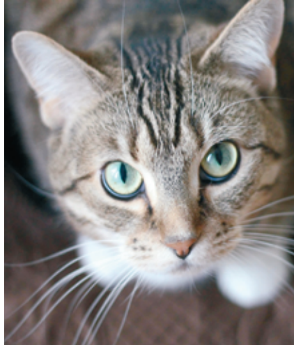
Un festival de moustaches s'annonce à Cort'Agora.

Il sera également possible d'acquérir divers jouets, arbres à chats, litières et petits plats qui combleront les