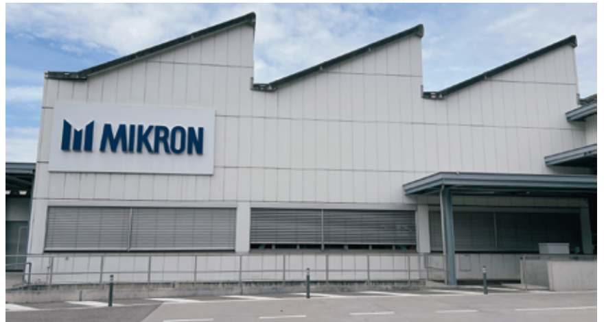
Avec le projet «BoudryNext», l'entreprise se lance dans de gros travaux