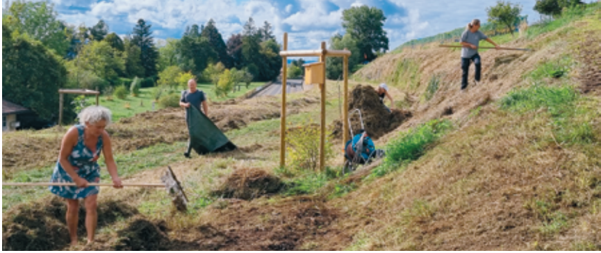
Une vue du ratissage de 2023.