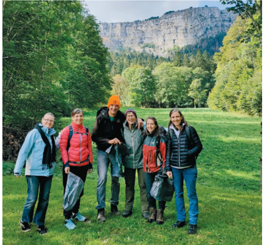
Les bénévoles au départ.

Les participants avaient la possibilité de choisir des contreparties à leurs dons. Entre le sirop maison et l'autocollant de l'association, certains donateurs ont