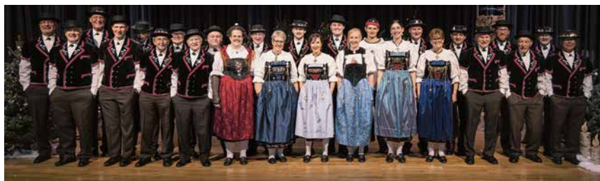
L'Echo vom Lindenberg.