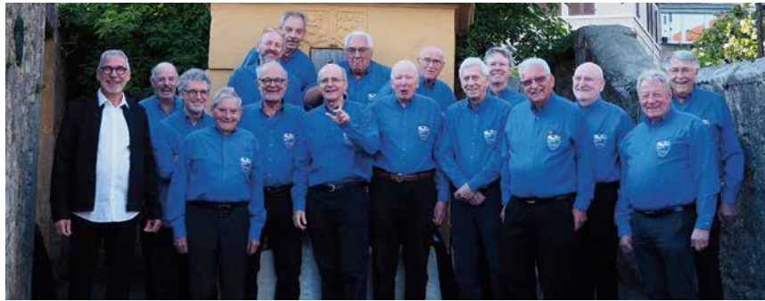
L'Echo du Lac.

Le président ajoute fièrement: «Notre chœur d'hommes a été fondé en 1885, ce qui en fait l'un des plus anciens du canton. Je me souviens de la sortie du 100e anniversaire qui nous a conduits aux Grisons. Nous avons chanté sans arrêt, en particulier dans le train. L'ambiance était formidable.» Actuellement l'effectif est de 20 chanteurs avec une moyenne d'âge supérieure à 50 ans malgré l'arrivée de trois choristes plus