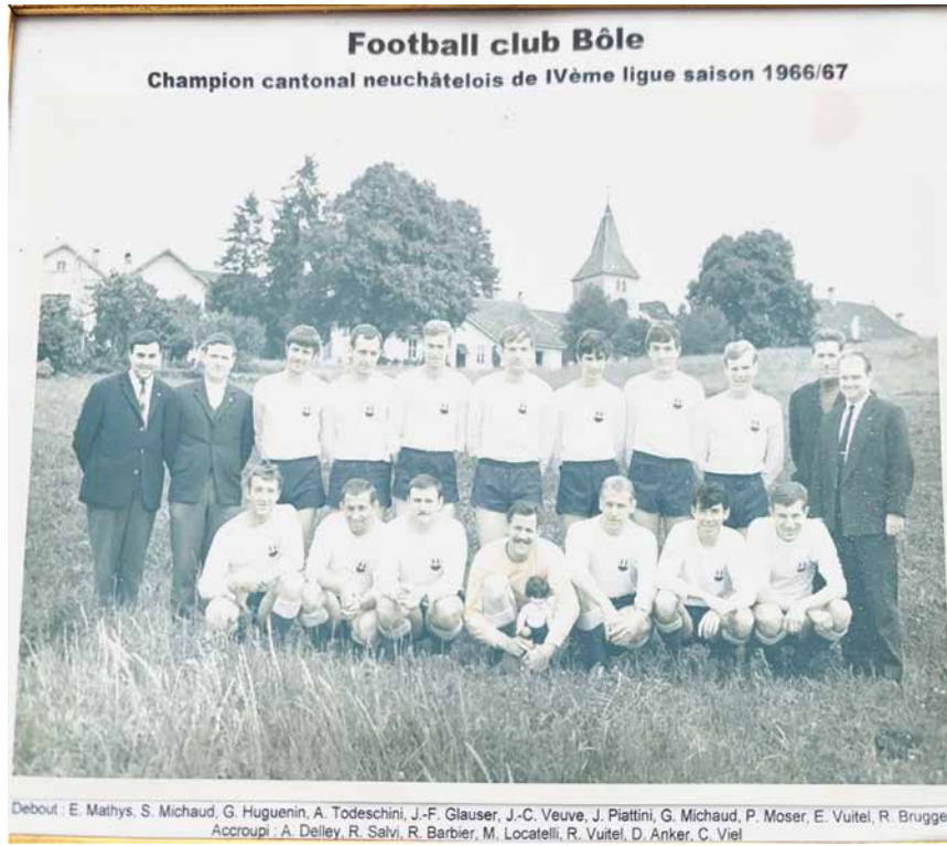
L'équipe du FC Bôle promue en 3e ligue en 1967, une année après la fondation du club. La photo, tirée des archives du club, avait été publiée à l'époque dans «L'Impartial».

Le club est promu en 3e ligue à la fin de