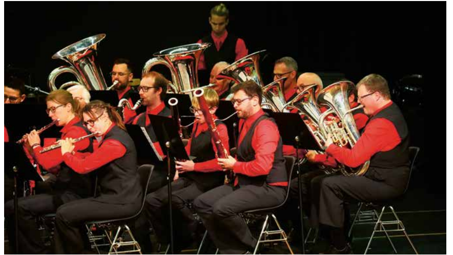
L'Harmonie de Colombier en concert à l'aula du gymnase de Bienne.