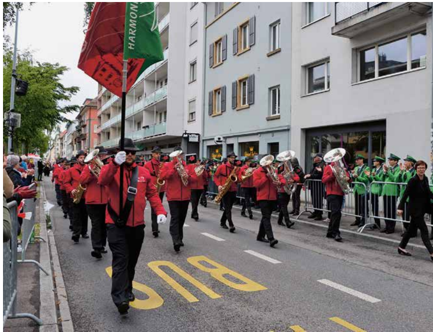
L'Harmonie lors de la parade musicale.