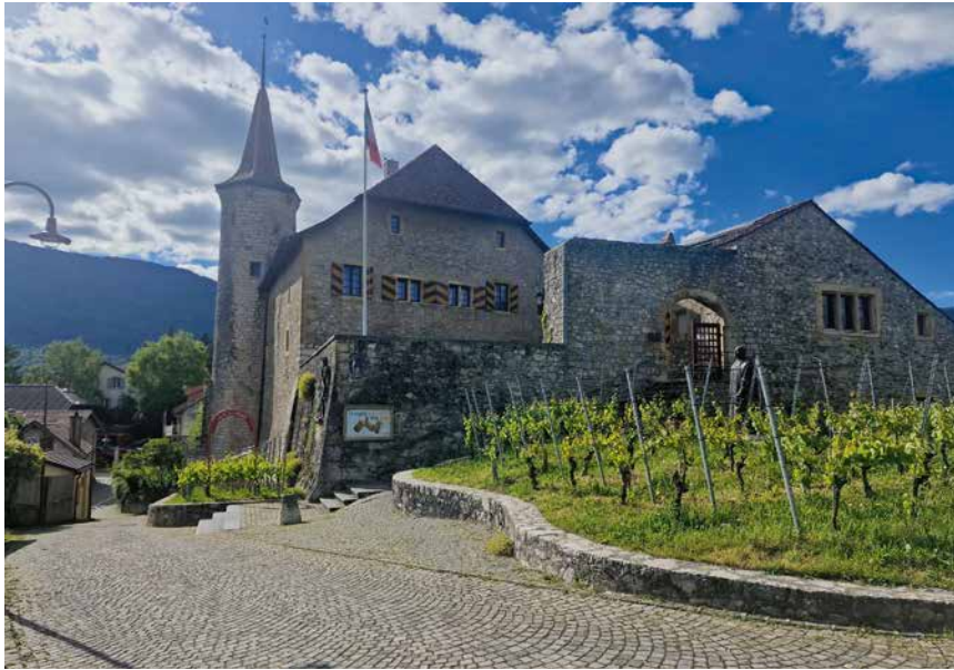
L'arrivée du marathon sera jugée devant le château de Boudry.

Ayant trouvé le lieu de départ, il s'agissait de fixer le lieu d'arrivée. «Nous avons calculé que cela devait se situer dans l'Ouest neuchâtelois», poursuit l'organisateur. «Le gérant du château de Boudry a été emballé par le projet.» Ne restait qu'à convaincre des encavages le long du parcours. «Nous avons rencontré beaucoup d'enthousiasme chez les viticulteurs, qui vont s'occuper des postes relais. Nous avons dû faire des choix en fonction de critères sportifs pour les répartir le long du parcours. En tout, il y aura douze relais, sans compter le départ et l'arrivée.»