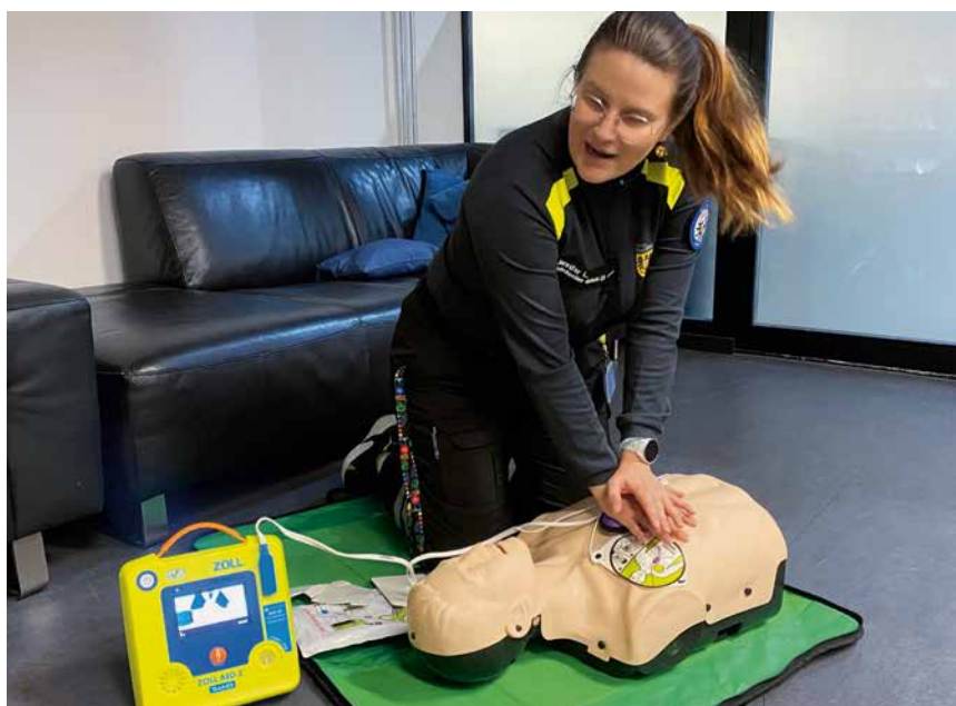
Jennifer Lopez vous enseignera le maniement des défibrillateurs avec enthousiasme.