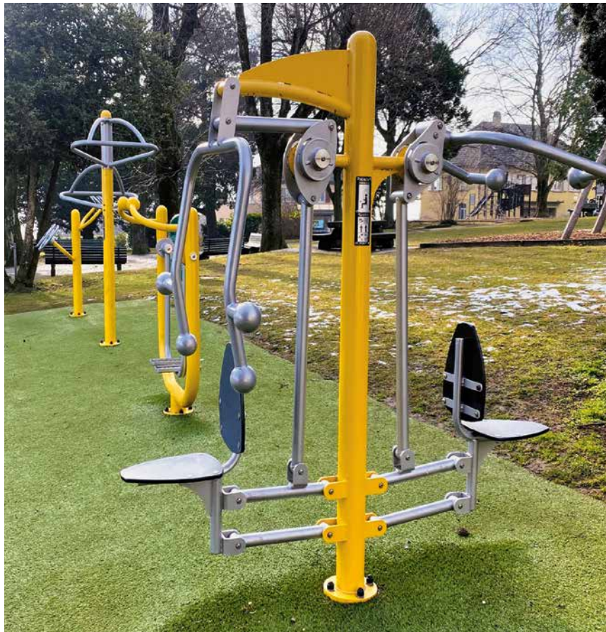
Parmi les mesures prises pour favoriser la santé, La Grande Béroche a installé ces équipements de fitness extérieur (ici à Saint-Aubin).