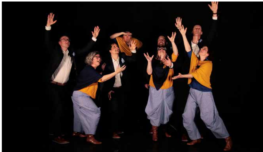
Bleu comme la Lune, une aventure qui dure depuis bientôt 20 ans.