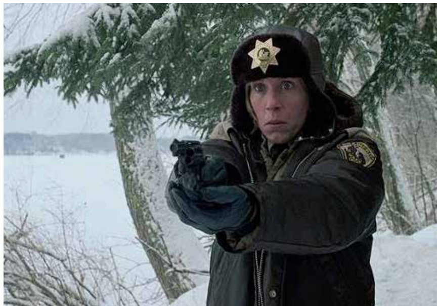
Le quotidien d'un policier du Minnesota est parfois mouvementé.

Pour cette première projection, Luca Da Pare a opté pour «Fargo», un film des frères Joel et Ethan Cohen, primé au Festival de Cannes 1996. L'intrigue, policière et familiale, se déroule dans