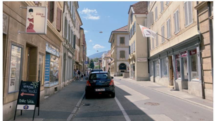
Une vingtaine de commerces se sont déjà déclarés partants.