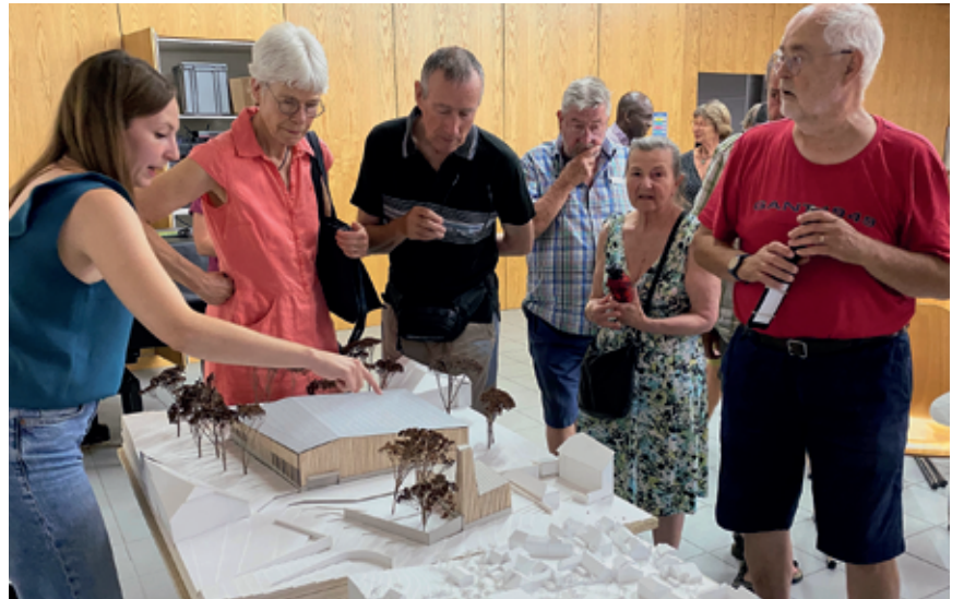
Une vue des façades ouest de la construction, composée de la salle polyvalente et du chauffage à distance, avec sa cheminée. La maquette a passionné les Matous.

Après un historique – il y a 10 ans, 5 millions de francs étaient prévus pour la salle –, Tom Egger a rappelé que l'objectif était maintenant de déterminer le crédit total à demander au Conseil général. «On parle d'environ 20 millions, 12 pour la salle, trois pour le chauffage à distance et trois pour le parking.» L'architecte a ensuite vanté son projet, parlant «d'intégration élégante de la salle» au sein du village et «de connexion forte entre le collège et le verger», via la plateforme prévue à l'entrée.