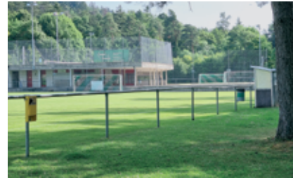
Le terrain de football de Bôle où des travaux de réfection auront lieu.

Le crédit de 191 000 francs pour l'aménagement du ponton 1 au port d'Auvergnier afin de l'adapter aux bateaux de nouvelles générations a été accepté à l'unanimité. Quant au crédit de 250 000 fr. pour la réfection du chemin d'accès au stade de football de Bôle, la reconstruction des gradins ainsi que le remplacement des bordures sur l'abri PC, il a suscité un débat nourri sur les matériaux utilisés en privilégiant, ceux naturels en calcaire pour l'enrochement et les pavés filtrant à la place du béton; au vote la