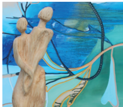
En arrière-plan, œuvre de Sabine Picard et en avant-plan une sculpture d'Olivier D. Barrelet.

Des poèmes accompagneront certaines des sculptures, comme «Horizon lointain», «Embrasser la terre et le ciel», «L'heure du grand voyage». «Ami de la nature depuis tout temps, je cherche des vieux morceaux de bois, qui m'interpellent et auxquels je donne une nouvelle identité, en les ressuscitant, afin de leur redonner beauté, noblesse, une vie nouvelle et pourquoi pas, un nouveau foyer», explique l'artiste. Celui-ci expose aussi une série de sculptures dans un espace intitulé «A votre bon cœur», où les visiteurs pourront se les approprier en y dépo-