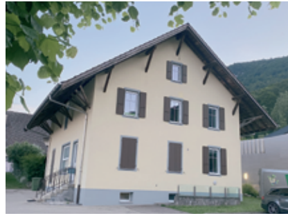
Le Conseil général a accepté à l'unanimité un bail de 20 ans, pour 200 m 2 avec jardin, place du Collège 6. Sans savoir exactement pour quel usage.