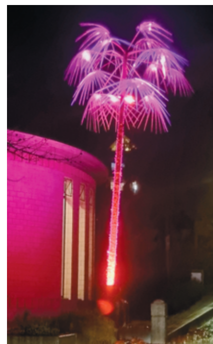
Le palmier réalisé par Pellaton paysagiste placé devant la salle de spectacle.