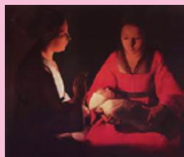
Le Nouveau-Né, 1648, huile sur toile.

Se préparer à Noël avec Georges de la Tour, peintre du XVII e siècle : une peinture spirituelle où la lueur d'une chandelle devient la lumière de l'âme, le feu de l'inspiration, la présence d'une grâce.