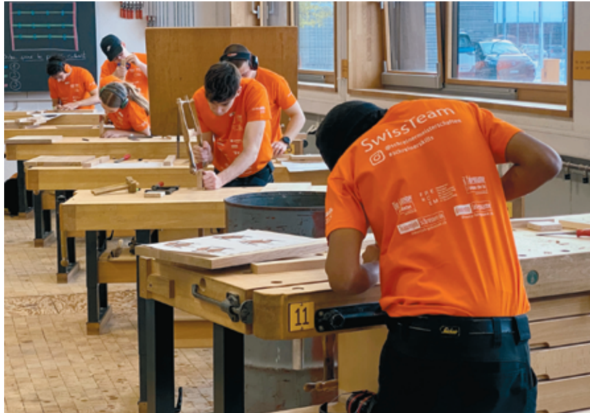
Sept heures pour fabriquer un escabeau: les apprentis se concentrent sur le défi.

Sur la quarantaine d'apprentis de 3 e et 4 e années, 16 filles et garçons sont en train de participer au championnat cantonal des menuisiers et ébénistes 2024, sous l'égide de l'Association neuchâte-