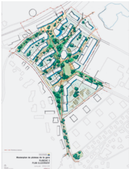
Esquisse du futur quartier.