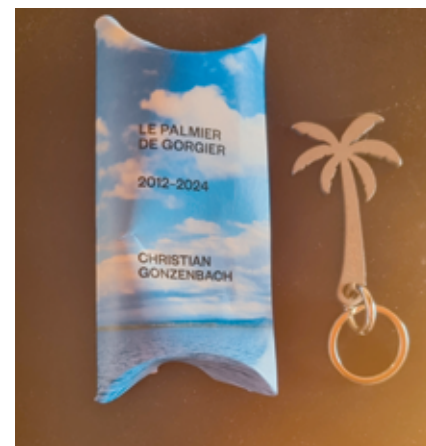
Le porte-clés avec son coffret.