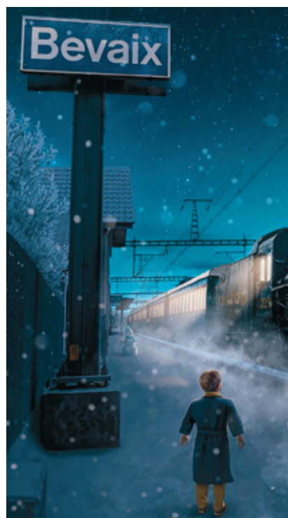
Le 11 décembre, «Le Pôle Express» s'arrêtera à Bevaix. Pour le plus grand plaisir des mômes...

Puis ce sera aux adultes de revoir un film qui, lui, a exactement 30 ans, mais fait partie des incontournables. Faut-il vraiment rappeler le pitch de «Forest Gump»? Souvenez-vous, cette comédie dramatique venue des