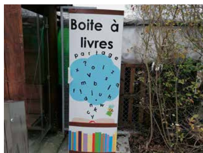
Les participants à l'inauguration ont apporté de nombreux ouvrages pour garnir la boîte.