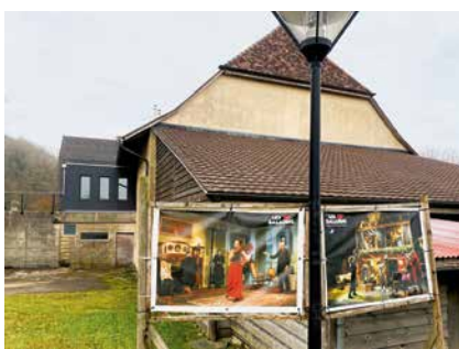
Quels seront les effets de la nouvelle politique sur les acteurs culturels, comme ici, à Bevaix, au théâtre des Baladins?

Objectif:ne a présenté une stratégie en cinq axes, que le Conseil communal semble avoir fait siens. «Littoral