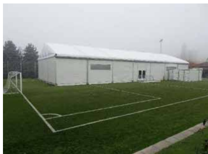
Une salle de gym provisoire – ici celle construite à Bevaix – sera montée sur un terrain jouxtant le collège des Esserts.

Les élus ont exprimé quelques remarques quant à l'absence de consultation initiale de la commission non permanente de suivi des travaux de Vauvilliers, alors que d'autres ont demandé une confirmation écrite du cercle scolaire qui accepte une salle de gym double, sans douches. Lors du vote final, tant l'urgence que le crédit ont été acceptés par plus de 90% des conseillers généraux.