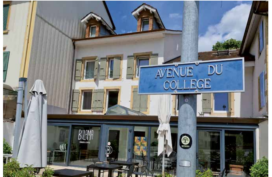
Le futur Centre des loisirs sera situé en face du tram.

Au nom du Conseil communal, Mallorie Schlaeppli a averti les élus que les gérants n'allaient pas brader leur pas de porte. Le