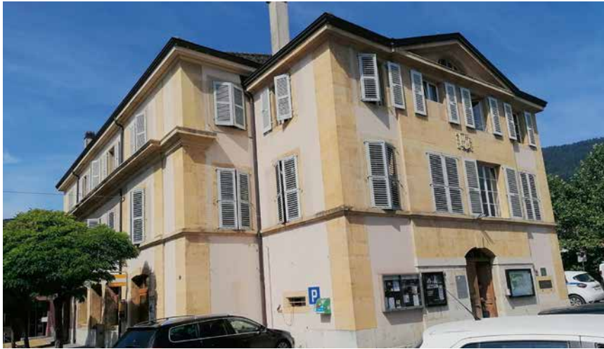
Un crédit de 100 000 francs a été accepté pour la réfection des volets du bâtiment administratif de Bevaix, le changement des fenêtres du corridor et l'amélioration de l'acoustique intérieure.

La commune se trouve néanmoins à un moment charnière car la planification financière 2026-2029 prédit un taux d'endettement problématique qui pourrait compromettre les investissements futurs. L'exécutif et la commission financière vont élaborer une stratégie financière rigoureuse mesurée avec des objectifs précis. Malgré quelques critiques quant au faible taux de réalisation des investissements projetés, les comptes ont été très largement adoptés.