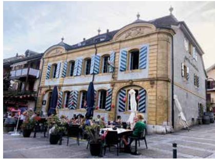
Le coût de l'assainissement de la ventilation de l'Hôtel de Commune a suscité des remarques.

Les crédits votés ensuite pour un troisième colombarium, une extension de