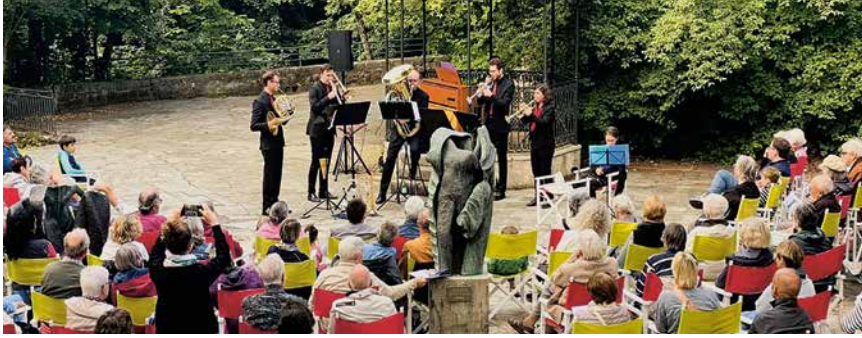
Sous le kiosque des Jeudis musicaux du Gor de Vauseyon, en 2024.