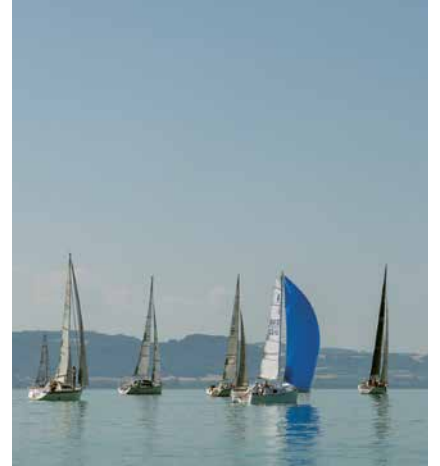
Des courses toujours élégantes.

Il sera aussi possible de se restaurer en journée, avec notamment les excellentes crêpes de Jeanlouis. Pour la soirée nul besoin de se déplacer car le BeRock fait son retour au bord du lac avec stands de boissons, nourritures et surtout une excellente