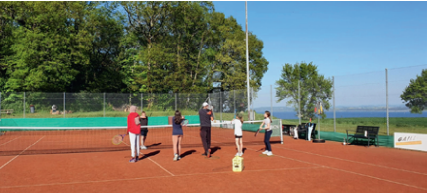
Des cours calibrés pour les futurs champions de la terre battue.

Ainsi le Tennis club Béroche-Bevaix-Boudry remet ça, notamment grâce au soutien de ses sponsors. Ces cours s'adressent aux enfants de moins de 19 ans. Par groupes d'environ six enfants, ils ont lieu en deux séries, la première à 15 h 45 et la seconde à 16 h 45. «Le but est de poursuivre la dynamisation du mouvement junior, initié en 2023, et de rendre accessible au plus grand nombre la découverte de ce sport passionnant», nous dit le responsable des juniors. Ce mouvement compte actuellement 49 juniors (contre 19 en 2023). Les bénéficiaires du programme deviennent membres du club pour un an. La cotisation est gratuite jusqu'à l'âge de 6 ans alors qu'elle ne s'élève qu'à 60 francs pour les 7 à 18 ans lors de la première année. Cela leur donne gratuitement libre accès, deux fois par semaine, aux courts de Gorgier.