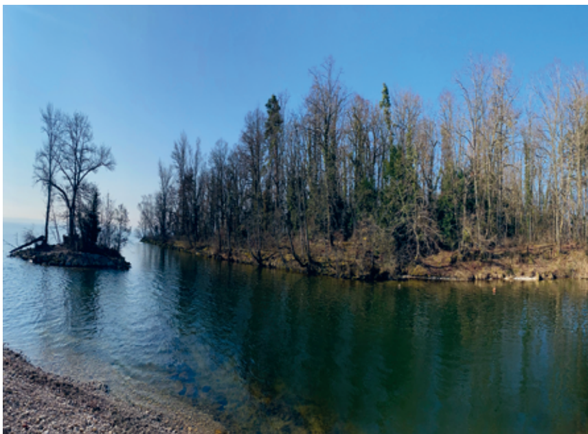
Le mur de la rive droite (repérable à sa ligne horizontale ensoleillée), une construction datant de la première correction des eaux du Jura.

Il y a quelques mois, cette rive de l'embou-