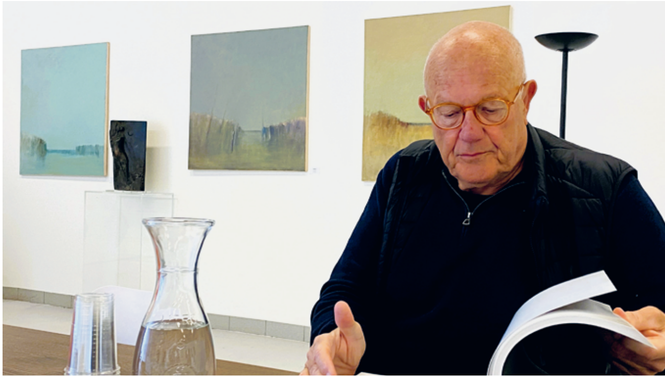
Philippe Jacopin: «Tout est vibration dans la peinture d'Aeberli.»