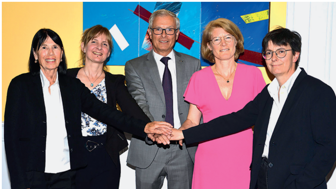
Les conseillers communaux souhaitent plus de dialogue avec la population.

«Tous les politiques réfléchissent à cette notion de proximité, assez complexe