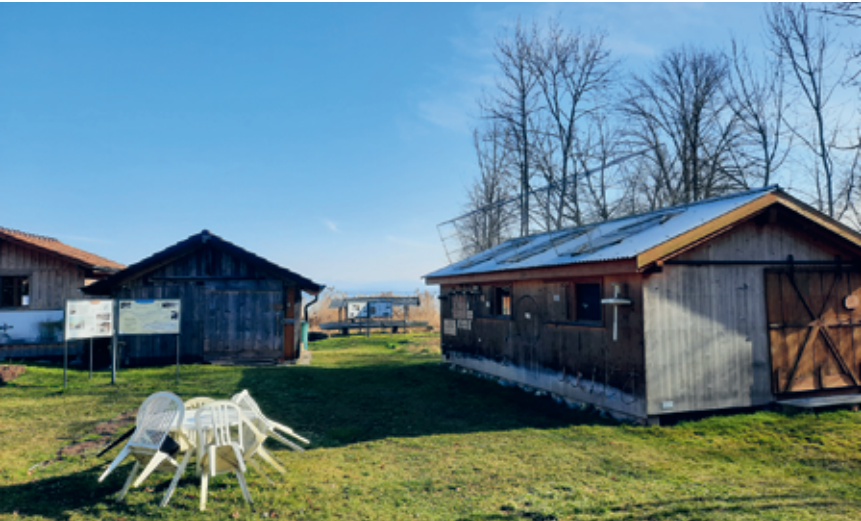
Toutes les cabanes de pêcheurs sont désormais rénovées.