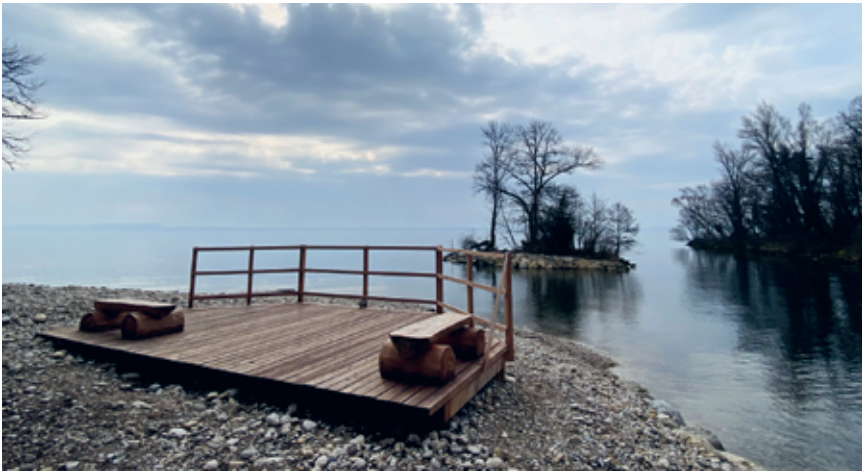
La plate-forme d'observation de la rive gauche.

«Littoral Région» a appris que le 11 mars, Patrimoine suisse, dont l'objectif est de préserver les monuments historiques de différentes époques, a été reçu par les autorités cantonales pour discuter de son opposition à la mise à l'enquête de la démolition du fameux mur: «On souhaite que cette construction soit intégrée au recensement architectural du canton de Neuchâtel par l'OCPI (Office