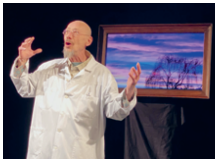
Le chimiste a fini par monter dans son arbre.