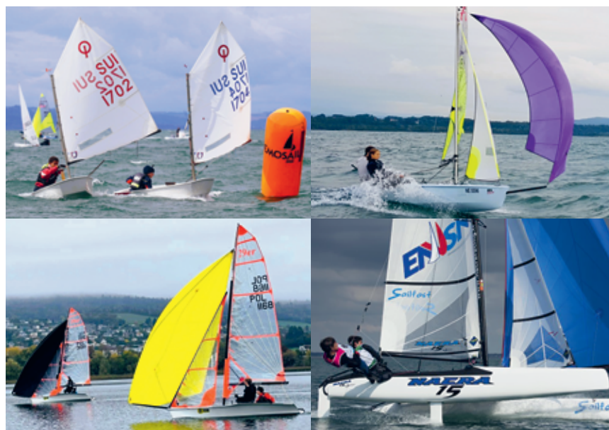
Les bateaux du CNB permettent une progression. De gauche à droite et de haut en bas: deux Optimist, un RS Feva, deux 29er et un catamaran Nacra 15.

Jusqu'ici, le saut était trop important entre les Feva et les catamarans. Et puis «l'occasion a fait le larron» avec ces deux 29er, dénichés en Pologne pour quelque 2000 francs, alors qu'un 29er neuf, «c'est bien 16000 euros», estime le président en ajoutant