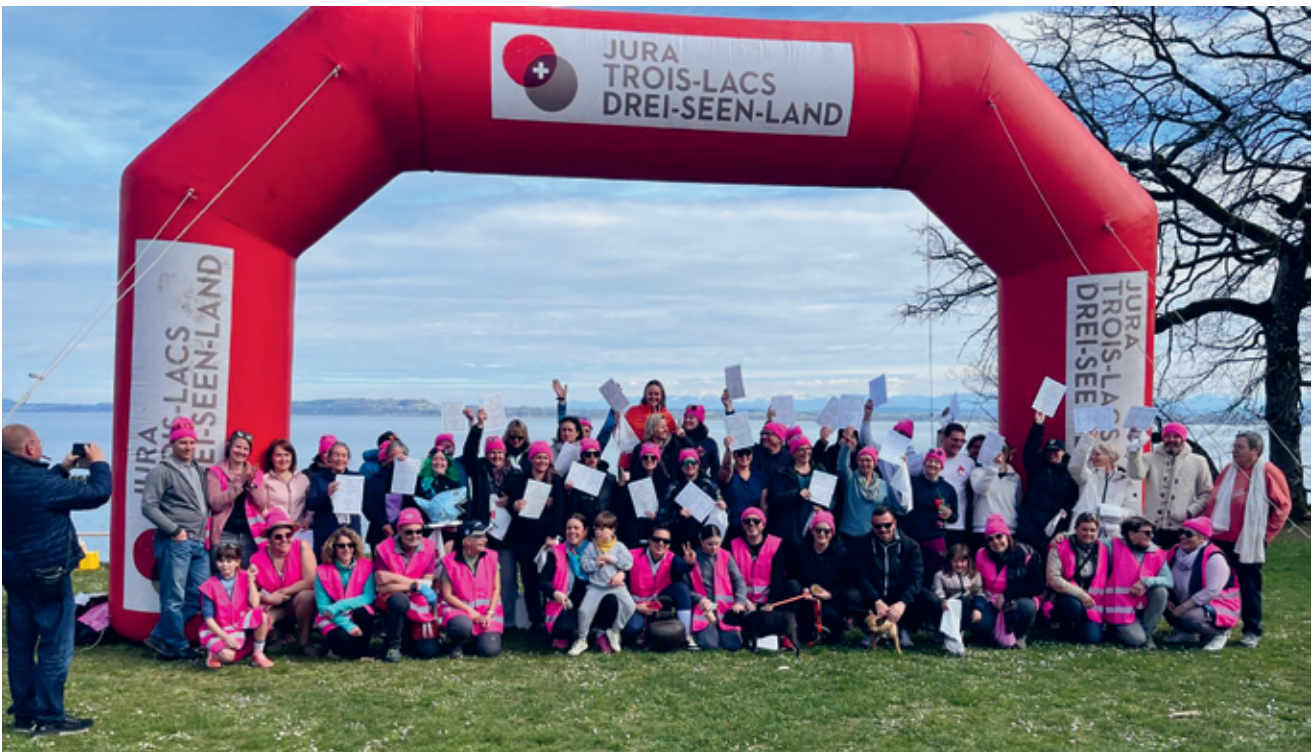
A la fin de la manifestation, tous les participants se sont vu décerner un diplôme de finisseur.