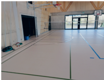
La commune ne veut pas de tables sur ce revêtement.

Si l'exercice 2024 de l'ASLGB boucle avec un bénéfice de quelque 2000 francs pour une fortune qui atteint maintenant 30000 francs, c'est grâce, notamment, à la prise en charge, par la commune, du déficit occasionné par le concert d'Aliose du 30 avril et aux 22 locations des 36 tables de l'ASLGB qui ont procuré 3700 francs de recettes.