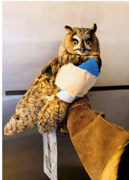
Après un choc avec une voiture, ce moyen-duc souffrait d'une fracture à l'épaule.

A Bevaix, le 12 février, Stéphanie Borel proposera une conférence au sujet des soins qu'elle prodigue, avec l'équipe de Sempach, à près de 1500 oiseaux chaque année. Des soins requis par des maladies propres aux quelque 80 espèces recueillies, ou encore, et surtout, des soins donnés en réponse à leur cohabitation avec l'homme: «Des accidents dus à la circulation routière, des électrocutions,