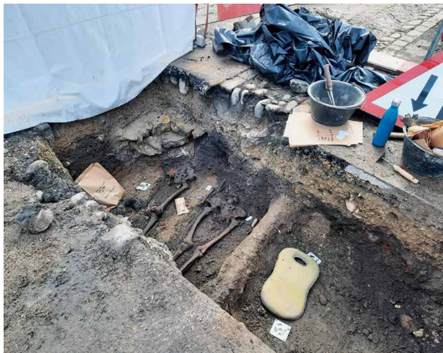
Des squelettes et des tombes du Moyen Age ont été découverts.