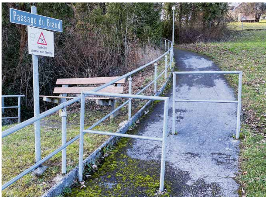
Un revêtement pour ne pas s'étaler au passage du Biaud? Le Conseil communal a promis d'y réfléchir.

Un itinéraire sécurisé pour les écoliers? L'exécutif a promis d'y réfléchir, sans pour autant donner de délai. Un revêtement qui évite de glisser le long du passage du Biaud? Les services techniques communaux verront si c'est possible. Un parcage au cabinet médical en dehors des heures de travail? La promesse faite aux opposants de l'époque ne le permet pas. Un abribus devant la maison de l'administration? L'étude sera faite dans le cadre de l'application de la LHand. Des grils à la Pointe du Grain? Impossible, c'est une zone protégée. Un colombarium au cimetière? On verra quand il y a aura désaffection partielle. Et ainsi de suite... Nous