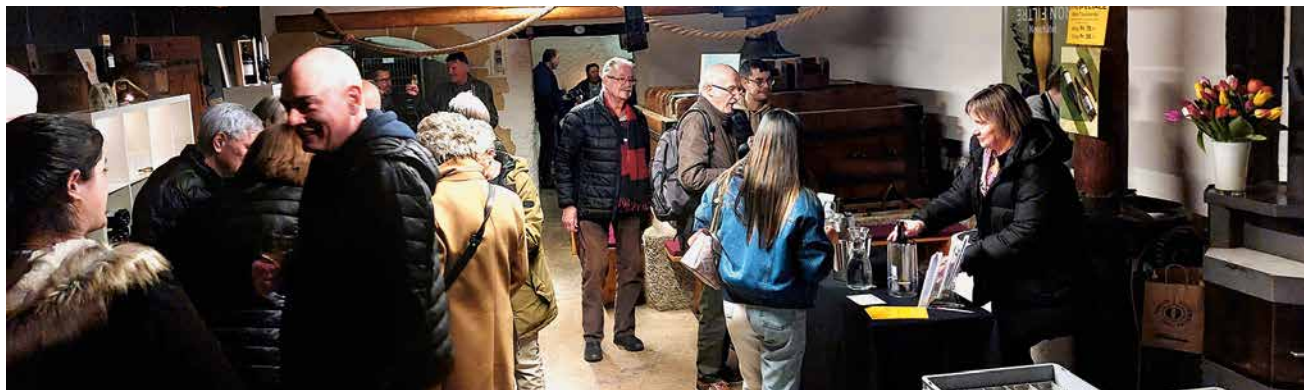
Les caves bondées contribuent à la convivialité de la manifestation.